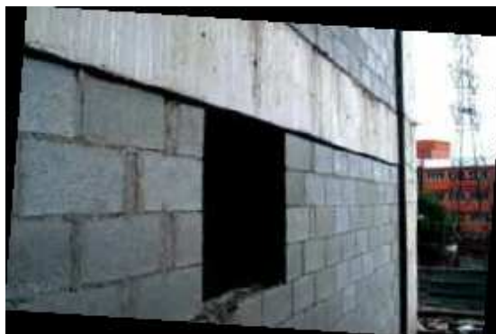
Região para aplicação da telha