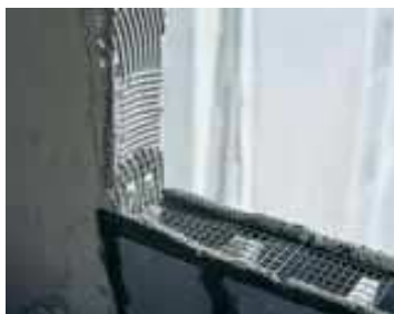
Ligação da Estrutura com a Alvenaria