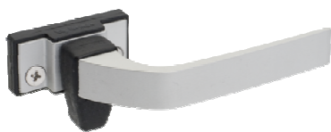
Trinco em alumínio Fermax ou similar