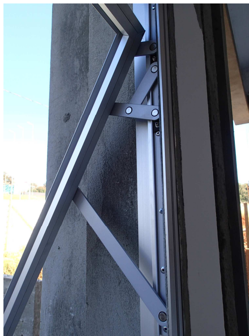
Sistema progressivo – Fermax ou similar