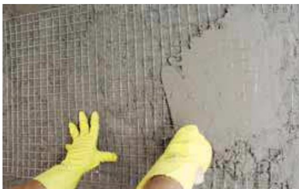
Aplicação de tela